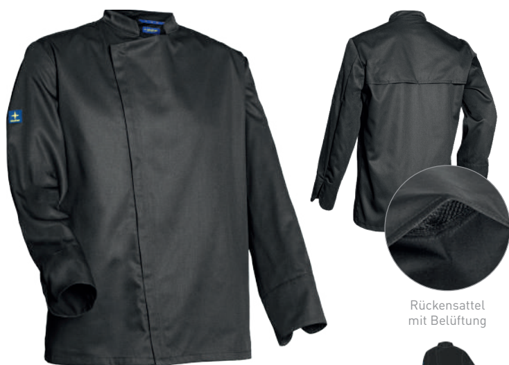
Rückensattel mit Belüftung