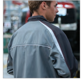
RÜCKEN REFLEXSTREIFEN UND KONTRASTKEIL