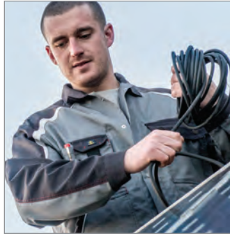
MULTIFUNKTIONS BRUSTTASCHEN KONTRASTKEIL