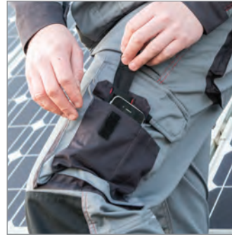
VERSTÄRKTE KNIE ZIP-OUT HANDYTASCHE