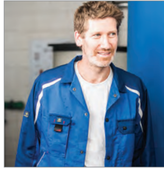
HOHE HALTBARKEIT GUMMIERTE DRUCKKNÖPFE